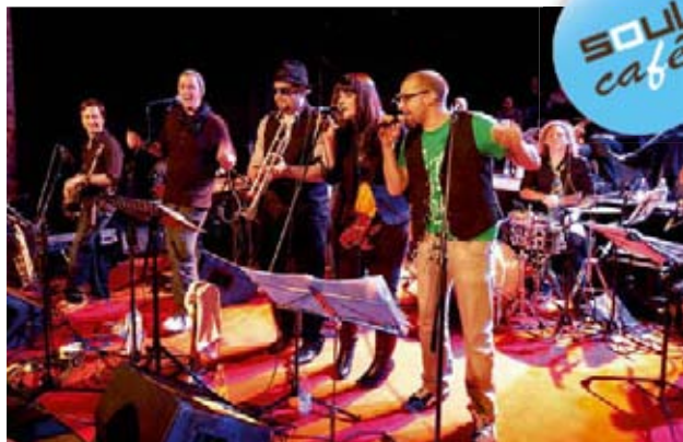
Feine Grooves, knackiger Funk und souliger Jazz am Samstag