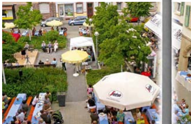
Impressionen vom Brahmplatzfest